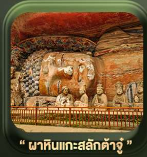
“ ผาหินแกะสลักต้าจู้ ”